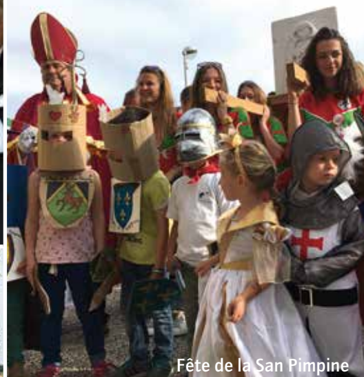
Fête de la San Pimpine