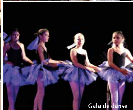
Gala de danse