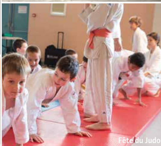
Fête du Judo