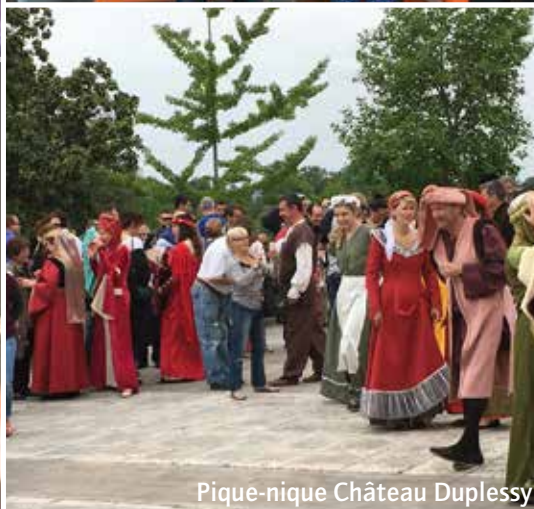
Pique-nique Château Duplessy