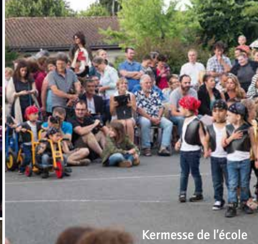
Kermesse de l'école