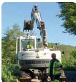
Travaux de voirie