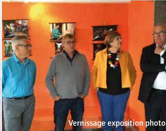
Vernissage exposition photo