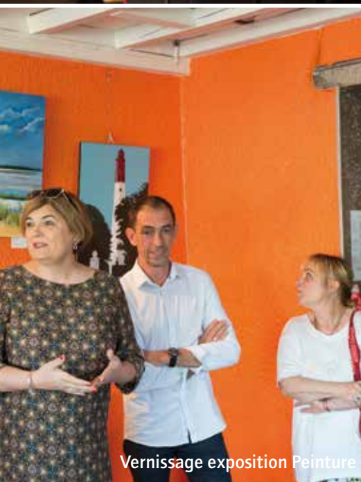
Vernissage exposition Peinture