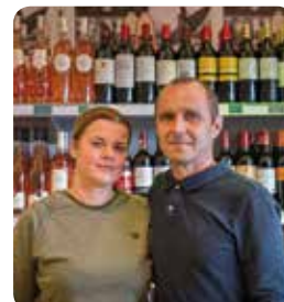
Changement de propriétaire chez Vival