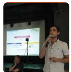
Révision du PLU