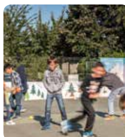
La rentrée à l'école de la Pimpine