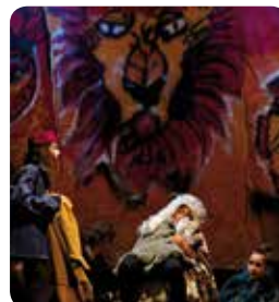
Fête des TAP : une vraie réussite