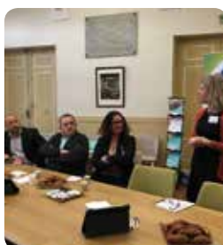
À la rencontre des chefs d'entreprise