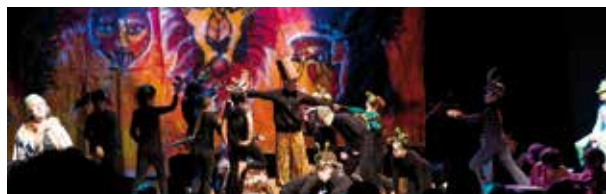
Le 16 décembre dernier, la salle culturelle était comble pour la fête des TAP. Une vraie réussite !