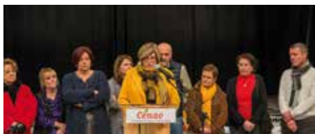
La traditionnelle cérémonie des vœux a eu lieu le 6 janvier dernier à la salle Culturelle