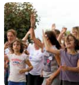
Retour en images : Cénac bouge