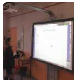
Un tableau numérique interactif à l'école