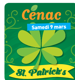
La Saint-Patrick à la salle Culturelle