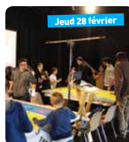
Les robots envahissent Cénac