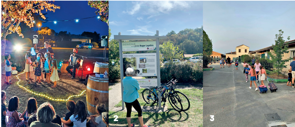
1. Les enfants ont donné de la voix lors de la Guinguette Cénacaise / 2. Festival Ouvre la Voix 3. La rentrée des classes et la découverte des nouveaux locaux .