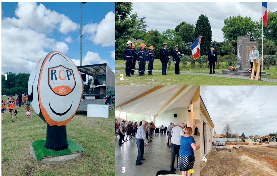
1. Le tournoi du Rugby Club de la Pimpine / 2. Cérémonie du 8 mai / 3. Thé dansant 4. Les travaux de l'école