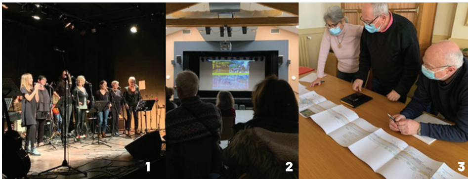
1. Audition des élèves de l'école Amac / 2. Conférence «la Garonne et le réchauffement climatique» / 3. Réunion sur les travaux du Pin Franc avec les référents de quartier