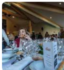
La journée des aînés