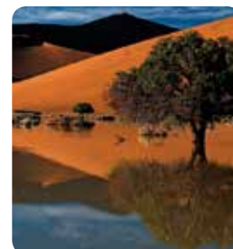
Exposition « Énergie »