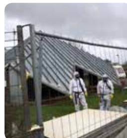
Démolition de la Maison pour Tous