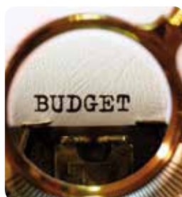
Vote du budget 2018