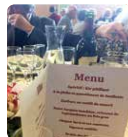
Repas des aînés du 28 janvier dernier