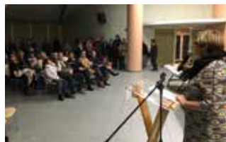
Le vendredi 12 janvier dernier, de nombreux cénacais sont venus à la salle culturelle pour les Vœux du Maire