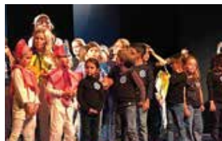
La fête des Tap a eu lieu le vendredi 22 décembre dernier à la salle culturelle.