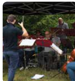
Festival Ouvre la Voix