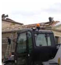
Rénovation de la toiture de la bibliothèque